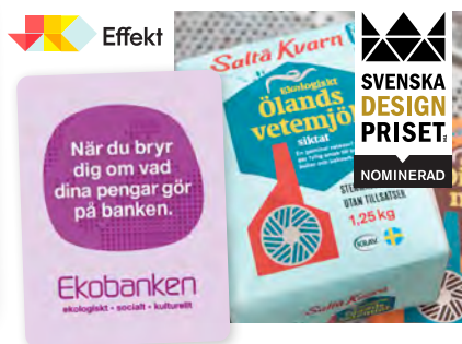
Två långa samarbeten.