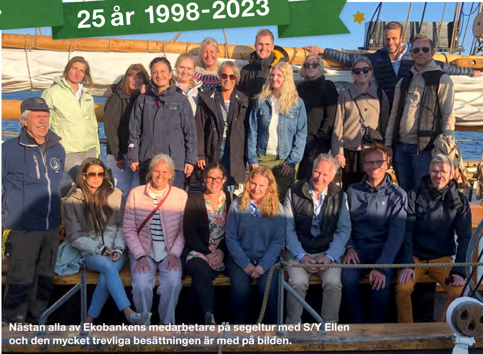
Nästan alla av Ekobankens medarbetare på segeltur med S/Y Ellen och den mycket trevliga besättningen är med på bilden.