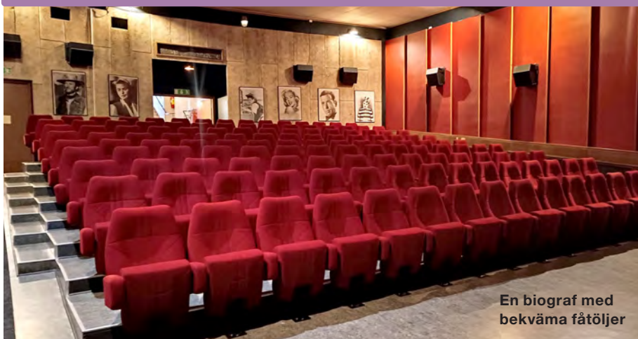
En biograf med bekväma fåtöljer