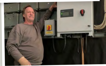
Tidafors solpaneler på taket