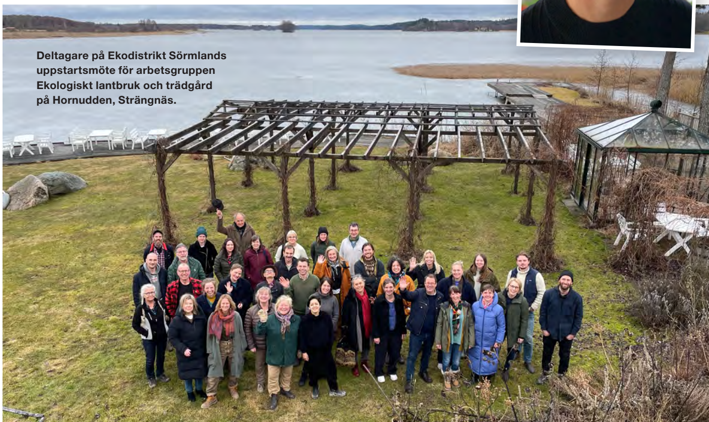
Deltagare på Ekodistrikt Sörmlands uppstartsmöte för arbetsgruppen Ekologiskt lantbruk och trädgård på Hornudden, Strängnäs.

Ekobanken har många samarbeten med Mikrofon- den där de ställer ut garanti för krediter och det gäller även för denna kredit.