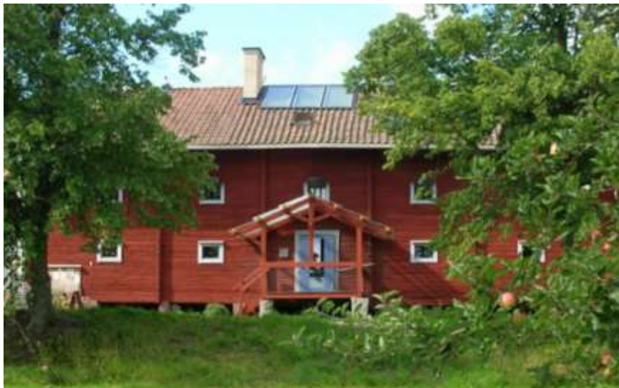
Ekobankens kontor i Järna, söder om Södertälje.

Styrelseledamöters (vice VD) uppdrag uppdatering