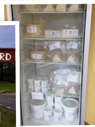
Mjölken från getterna säljs till Järna Mejeri som sedan säljer den som färsk mjölk, yoghurt respektive färsk- och hårdost.