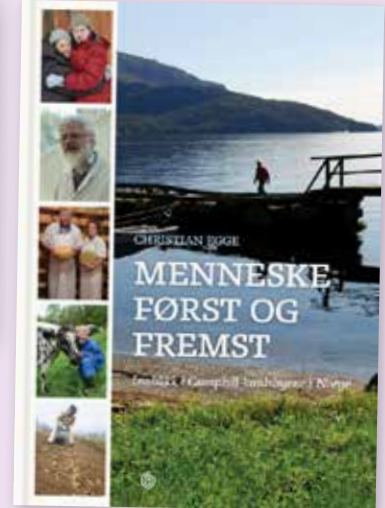
Camphillrörelsen arbetar integrativt med människor med funktionsvariationer inom ramen för bygemenskaper.