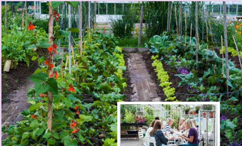
Ekologiska odlingar.

– Vi är ett arbetsintegrerade socialt företag som tillsammans hjälper människor att hitta ett sätt att komma tillbaka till arbetsmarknaden. Vi skapar samarbeten med företag som sedan är villiga att ge perso-