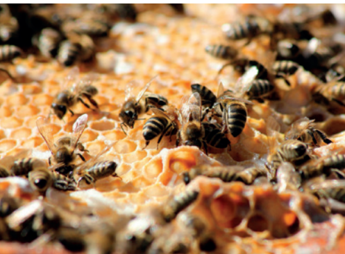
På Vårdinge by Folkhögskola har man nu en ekologisk biodlarutbildning.

”En bygggemenskap är en grupp människor som utifrån sina egna ambitioner tillsammans planerar, låter bygga och använder en byggnad.”