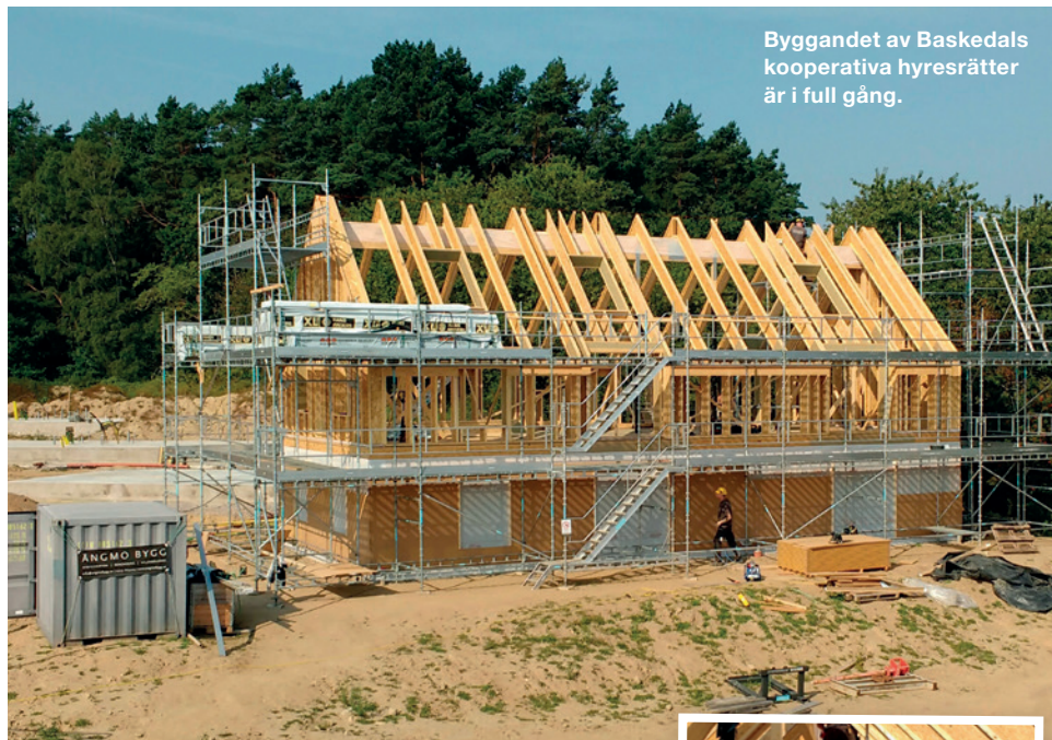
Byggandet av Baskedals kooperativa hyresrätter är i full gång.

Ekobanken ekologiskt - socialt - kulturellt