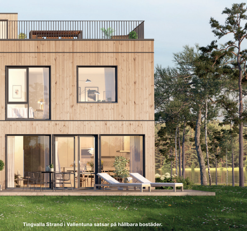
Tingvalla Strand i Vallentuna satsar på hållbara bostäder.

Drivkrafterna i en bygggemenskap skiljer sig åt men ofta är det att man vill bo tillsammans med vissa människor, till exempel vänner eller andra med samma intressen, vill ha trygghet och närhet till andra när man blir äldre. Man vill bo i en viss typ av byggnad, påverka kostnaden för sitt boende eller alltid drömt om att vara med om att rita och bygga ett hus. Utgångspunkten är ändå i alla lägen det mänskliga. För att en bygggemenskap ska fungera behöver man känna tillit till de andra i projektet, vara prestigelös och så krävs det en smula mod att dra igång ett stort byggprojekt. →